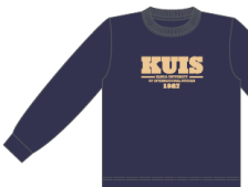
パープルネイビー ×クリーム