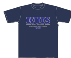
パープルネイビー× リフレックスブルー・シルバー