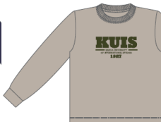
ミルキーグレー ×オリーブ