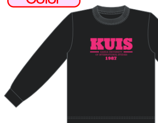
スミクロ ×ホットピンク