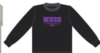
スミクロ ×パープル