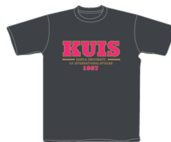
スミクロ× ホットピンク・ゴールド