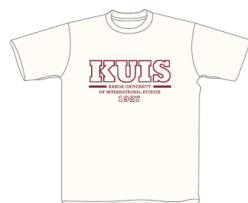
ナチュラル×ワインレッド