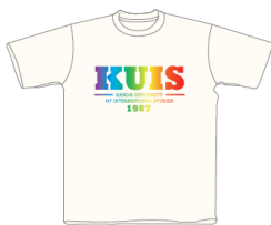
ナチュラル×レインボー (インクジェットプリント)